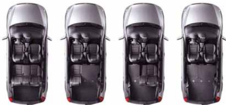
● Sva sedišta uspravna. ● Spuštena sedišta (40/60). ● Spuštena sedišta (60/40). ● Potpuno spuštena sedišta